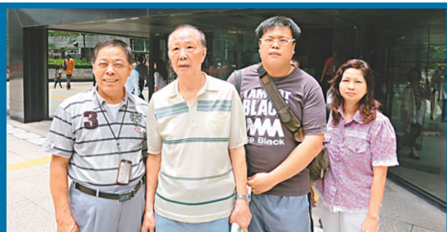
兩座大廈中間被搭建物遮蓋，令街道「不見天日」。