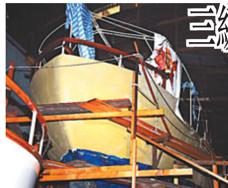
當日船廠在維修期間被地盤大火波及燒毀的「慕蓮夫人號」。

後，約3至14小時後陸續出現腸胃炎徵狀，包括腹痛和肚瀉，他們沒有求診。第二宗個案涉及1男2女，年齡介乎5至40歲。他們於上月28日在同一食肆用膳，約11至15小時後陸續出現腹痛、噁心和肚瀉的徵狀，他們均沒有求診。第三宗個案涉及2名男子，年齡分別為38及55歲。他們於本月5日在同一食肆用膳。據悉，病者曾分別進食炸蔗蔥、咖哩蝦、香茅燒魚、紅酒燴牛尾、熟牛肉湯河及番茄蟹燴等。目前全部人的情況穩定，衛生防護中心正跟進調查。