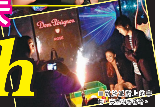
■對於派對上的事物，安室均感新奇。