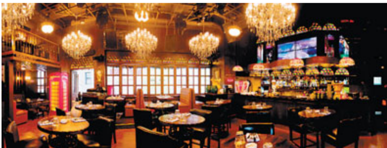
卡里奧酒吧的設計帶有英式古典風格