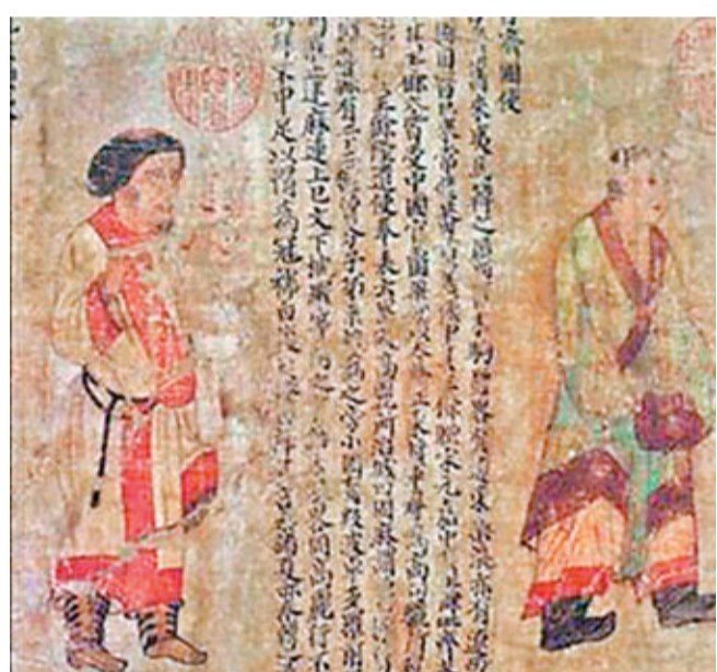
■ 古代畫冊中的圖案