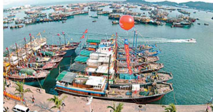
陽江開埠——國家中心漁港

為優化投資環境，陽江狠下苦功。陽江水陸交通運輸網絡已經形成，現代化的通信、供水、供電設施一應俱全，市政、生活設施配套，空氣清新，環境優美，市容市貌日新月異。同時為着力營造低成本的營商環境，還先後制訂實施一系列優惠政策。最近，陽江市委、市政府繼續強力推動投資服務管理中心的改革，市和各縣（市、區）均成立了行政服務中心，所有審批服務事項集中辦理，做到承諾辦結時間比法定時間減半，實際辦結時間比承諾時間減半「雙減半」，大大提高了機關辦事效率，進一步優化投資環境。一次次領風氣之先的創新之舉，使得陽江的投資創業環境不斷改善和提升，釋放出巨大的生機和活力。