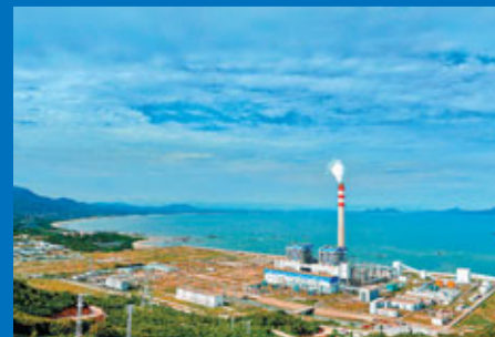
廣東華陽西電廠概貌

陽西縣位於廣東省西南沿海，山海兼優，氣候宜人，資源豐富，交通便利。在陽江市委、市政府的正確領導下，陽西縣委、縣政府積極貫徹落實科學發展觀，解放思想，開拓創新，帶領全縣人民攻堅克難，團結奮進，紮實工作，經濟和社會發展都取得了顯著的進步。