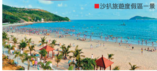
沙扒旅遊度假區一景

憑借優越的地域優勢、豐富的資源條件、開放的發展思路、宏大的發展氣魄，廣東省西南沿海的陽西縣近年來發展迅猛，在眾多欠發達地區中異軍突起、屢創佳績。2011年換屆後的新一屆黨委、政府領導班子進一步解放思想，創新發展思路，緊緊圍繞「跨越發展、幸福追趕」的目標，堅持以「先築巢後引鳳」的發展理念，立足資源優勢，大力實施新型工業化、農業現代化、旅遊特色化、城鄉一體化「四輪驅動」戰略，致力打造五大產業平台，不斷優化投資環境，助推陽西發展新跨越。