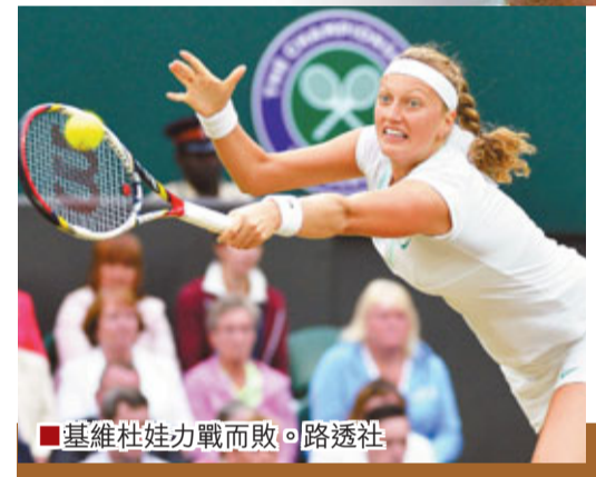
基維杜娃力戰而敗。