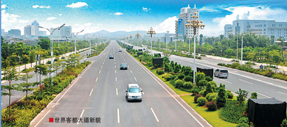
■世界客都大道新貌

「一園兩特帶動一精」產業發展戰略中的「一園」就是以全力打造梅州高新技術產業園為龍頭帶動全市新型工業化快速發展，「兩特」就是建設文化旅游特色區和特色宜居城鄉，而「一精」就是精緻高效農業，這四者是有機結合的整體。發展好了「一園」，建好了「兩特」，「一精」自然就被帶動起來了，這是在高起點上對梅州的產業進行重新佈局，具有很強的前瞻性和科學性。