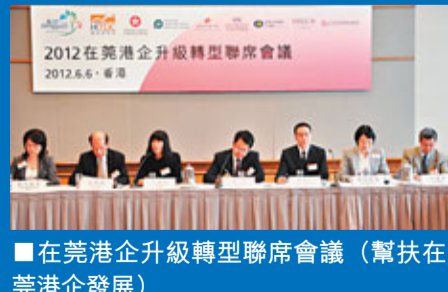
■在莞港企升級轉型聯席會議(幫扶在莞港企發展)

此外，東莞將深化外資項目審批改革，提高機關行政效能。對新設外資項目進行審批流程再造，前置審批改革為後置管理，優化審批流程，簡化企業申報資料。