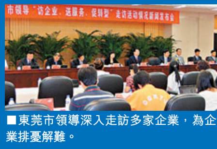
■東莞市領導深入走訪多家企業，為企業排憂解難。