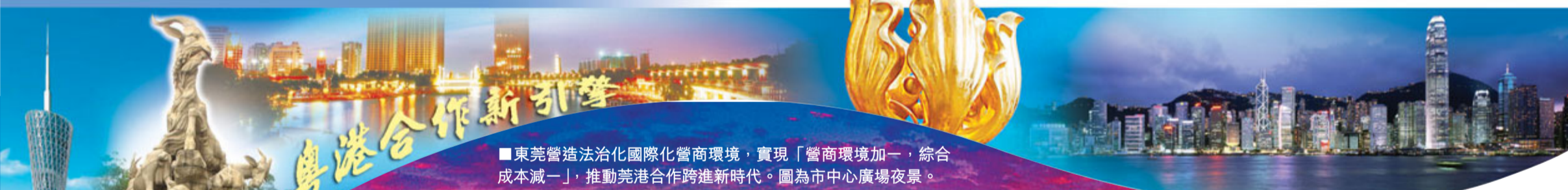
■東莞營造法治化國際化營商環境，實現「營商環境加一，綜合成本減一」，推動莞港合作跨進新時代。圖為市中心廣場夜景。

梅州交通便利、山水秀美、文化豐厚，既是投資創業的寶地，也是休閒度假和享受生活的好地方，更是投資者大展鴻圖的舞台。