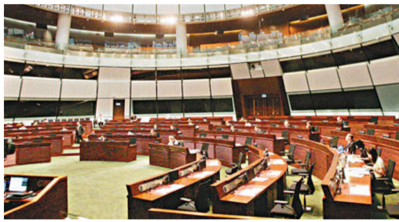
立法會昨日三讀通過反恐修訂條例。

傷害。他又稱，自殘患者較難感到痛楚，患者需要服用精神科藥物，如「納曲酮」，把患者的觸覺調至正常水平，在遇上傷害時能感到痛楚，而停止自殘行為。他又稱，患者應接受教育、情緒控制和行為治療，減少自殘行為。