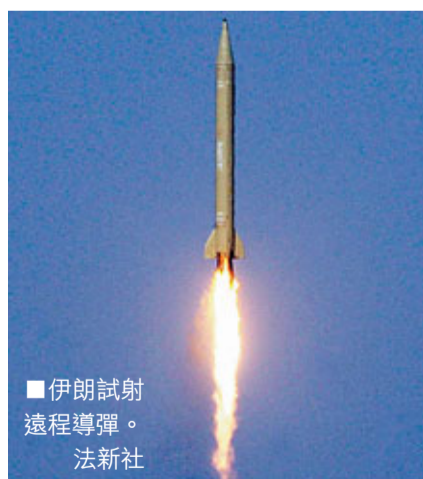
伊朗試射遠程導彈。

伊朗局勢再趨緊張，《紐約時報》報道，美國暗中增派軍隊駐紮海灣地區，以確保霍爾木茲海峽開放，並在必要時即時出兵。同時，伊朗革命衛隊昨日據報成功試射遠程導彈，射程足