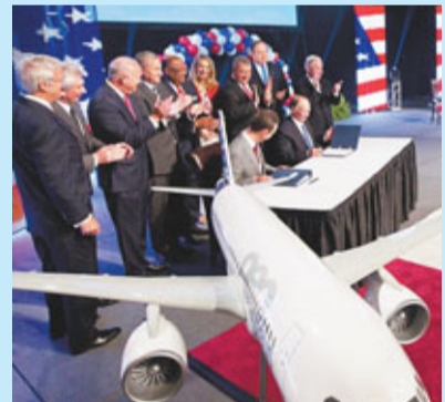
空巴總裁和亞拉巴馬州州長簽署協議。

濟上，將成本轉為美元可減少匯率風險，而且美國南部工會勢力遠不及歐洲本土，可降低勞工成本，更有助向歐洲工會施壓；政治上，在美國設廠也有助爭取華府龐大國防預算，增加公司與波音競爭的能力。