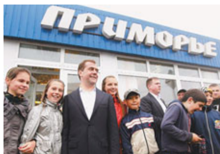
梅氏(左3)與國後島居民合照。

俄羅斯總理梅德韋傑夫昨日再登上俄日有領土爭議的南千島群島(日稱北方四島)之一的國後島，引起日本政府不滿，隨即傳召俄國駐日大使抗議，聲明國後島「是日本固有領土」，並對事件表示「極度遺憾」。