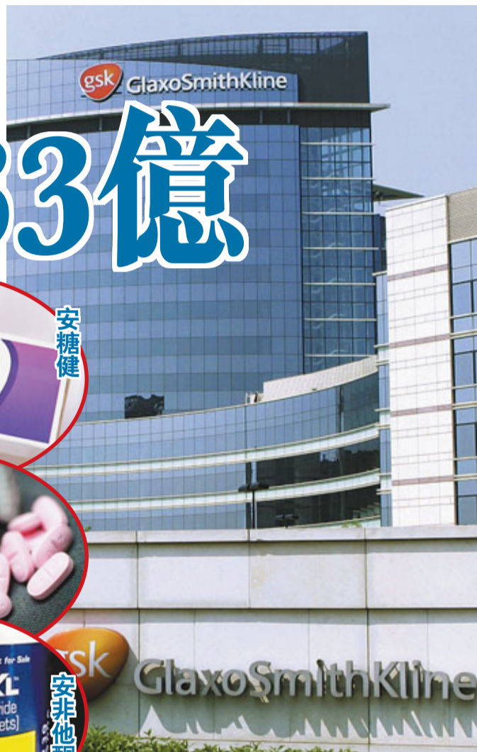
葛蘭素史克同意華府加強監管其銷售行為。圖為該公司位於倫敦的總部。