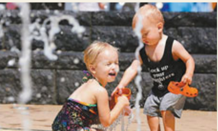
兩名女童在噴泉下嬉水消暑。

美國廣泛地區遭熱浪侵襲，全國各地單在6月便破了3,215項高溫紀錄。酷熱天氣不僅導致多人死亡，更威脅美國穀物收成，由於美國是全球最大玉米、大豆及小麥出口國，且玉米和大豆儲量較少，因此即使是收成稍微減少，也可能刺激全球穀物價格上漲。