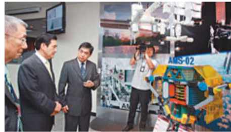
■馬英九(左2)3日在模型前聆聽工作人員解說。

馬英九說，「中科院」負責執行太空磁譜儀亞洲監控中心的任務，6月15日已通過NASA測試過關，確認台灣有符合國際標準的監測中心，展開各種數據研究。「中科院」已派遣6位種子專家，前往美