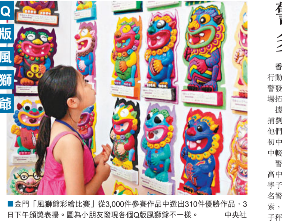
■金門「風獅爺繪彩比賽」從3,000件參賽作品中選出310件優勝作品，3日下午頒獎表揚。圖為小朋友發現各個Q版風獅爺不一樣。