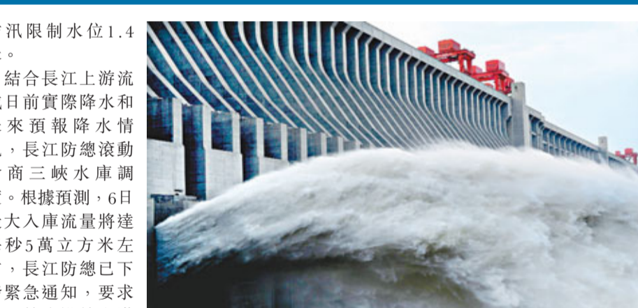
三峽大壩昨日開閘泄洪。新華社

香港文匯報訊 綜合新華社及中國廣播網報道 2日，受長江上游強降雨影響，三峽大壩迎來今年第一場較大洪水。受下洩流量影響，葛洲壩一號船閘開始停航。這是今年首次洪峰到達三峽大壩。昨日上午，今年汛期長江第一次洪峰抵達三峽水域。按照長江防總的調度，三峽大壩今年首次開閘下洩洪水。 三峽水利樞紐梯級調度通信中心提供的實時水情顯示，今年汛期長江首個洪峰出現在昨日8時，流量為每秒4.2萬立方米，刷新了今年三峽入庫流量的最高紀錄。