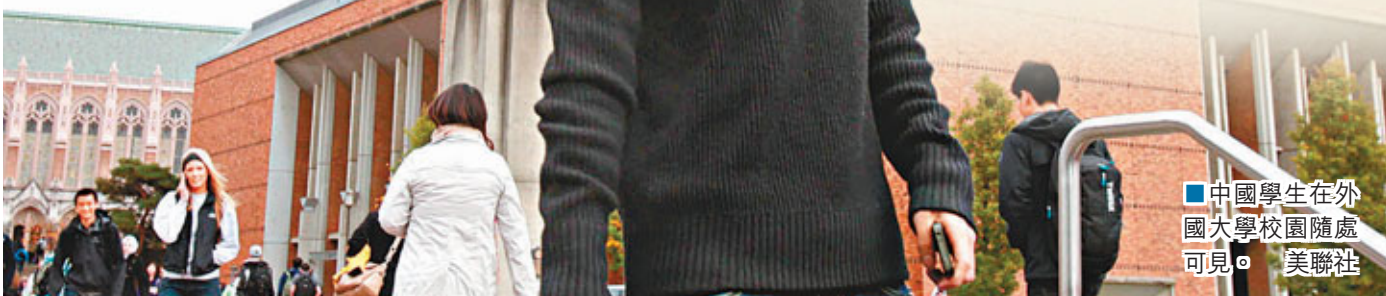
■中國學生在國外大學校園隨處可見。 美聯社

「比如異地高考問題。江浙地區有大量的外來務工人員，如何實現他們的子女公平的受教育機會，需要做大量的工作。」