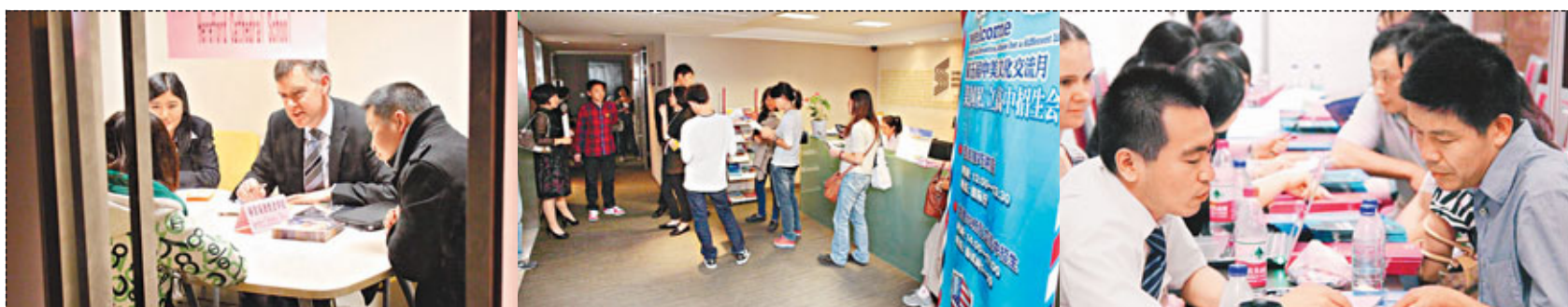
■英國高中學校校長親自來華招生。