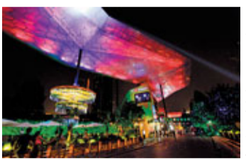
夜晚的成都蘭桂坊

在張旭看來，蘭桂坊入住成都，不僅僅是簡單的組合了餐飲娛樂行業的一些租戶，最為重要的是它帶來了一種全新的文化和生活體驗，而這種新的文化和生活體驗在很大程度上正改變着成都年輕人的生活方式。