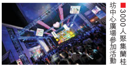
坊中心廣場參加活動 3000人聚集蘭桂坊