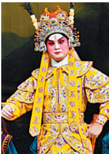
龍貫天演貪狼星儂智高。