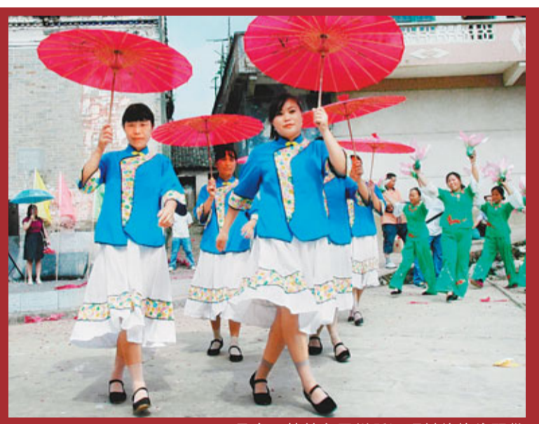
2日，是廣西桂林市靈川縣江頭村的傳統習俗節日——姑娘節，圖為年輕的姑娘們穿上節日盛裝，載歌載舞，以舞會友，以歌傳情。

戰犯管理所開展了法制教育，管理所先給他們分發了一批居留中國的日本人辦的進步書刊，如《民主新聞》、《前進》等雜誌，使戰犯們的文化生活逐漸豐富起來。管理所並成立學習小組。學習小組帶領廣大戰犯學習真理，明辨是非，對戰犯的思想改造起到了積極的作用。(之三) ■摘自《黨史博覽》