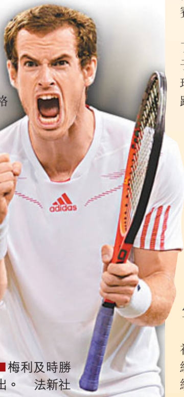
■梅利及時勝出。