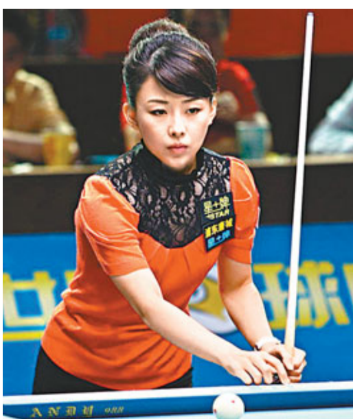
■潘曉婷亮相桌球團體賽。 資料圖片

據介紹,是次賽事中國隊作為東道主,派出兩支參賽隊伍,分別是中國一隊和中國二隊,經過抽籤,中國一隊被抽在B組,同組對手有芬蘭、馬來西亞以及加拿大,中國二隊身處C小組,同組對手有中國香港、新加坡以及澳洲。