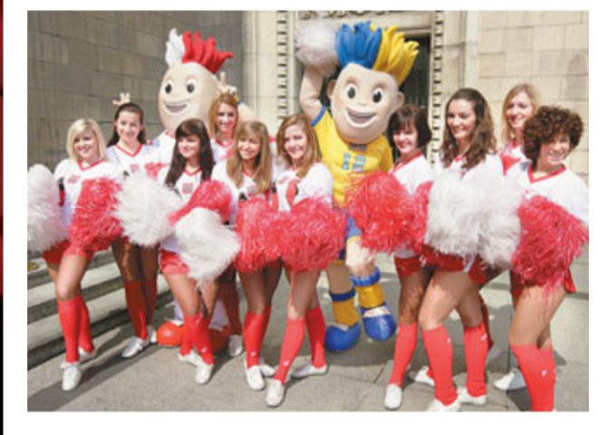
■波蘭與烏克蘭合辦的2012歐國盃圓滿結束。