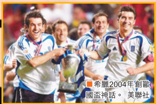
●希臘2004年創歐國盃神話。

歐足聯主席柏天尼說過，擴軍後足球弱旅有更大機會亮相歐國盃舞台。不過事實上，要靠如此大規模的擴軍才出線，恐怕只會是增加了更多的陪跑或魚腩分子，以及歐足聯的轉播費及入場門票等等的收入。