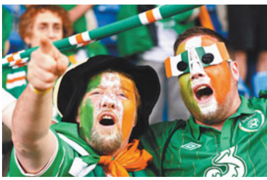
■愛爾蘭球迷表現得極具體育精神。

本屆歐國盃，愛爾蘭小組賽3場皆負，積分排名墊底慘遭淘汰，但媒體和公眾紛紛對愛爾蘭的球迷大加讚揚。不論是在波茲南還是在格但斯克的比賽，愛爾蘭球迷始終堅定支持自己的球隊。尤其是在愛爾蘭0:4不敵西班牙的那場分組賽中，當球隊大比數落後時，全場愛爾蘭球迷始終高聲歌唱，用愛和鼓勵陪伴球隊戰至最後一刻，讓無數人深深為之感動。