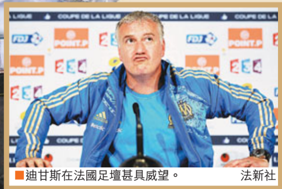
■迪甘斯在法國足壇甚具威望。

法足總公報稱，勒格拉埃已獲知白蘭斯的決定，並對白氏從2010年8月擔任法國隊主帥以來所做的工作表示敬意。法足總周二將舉行會議，並於會後舉行新聞發布會。在那之前，他們沒有任何其他評論。