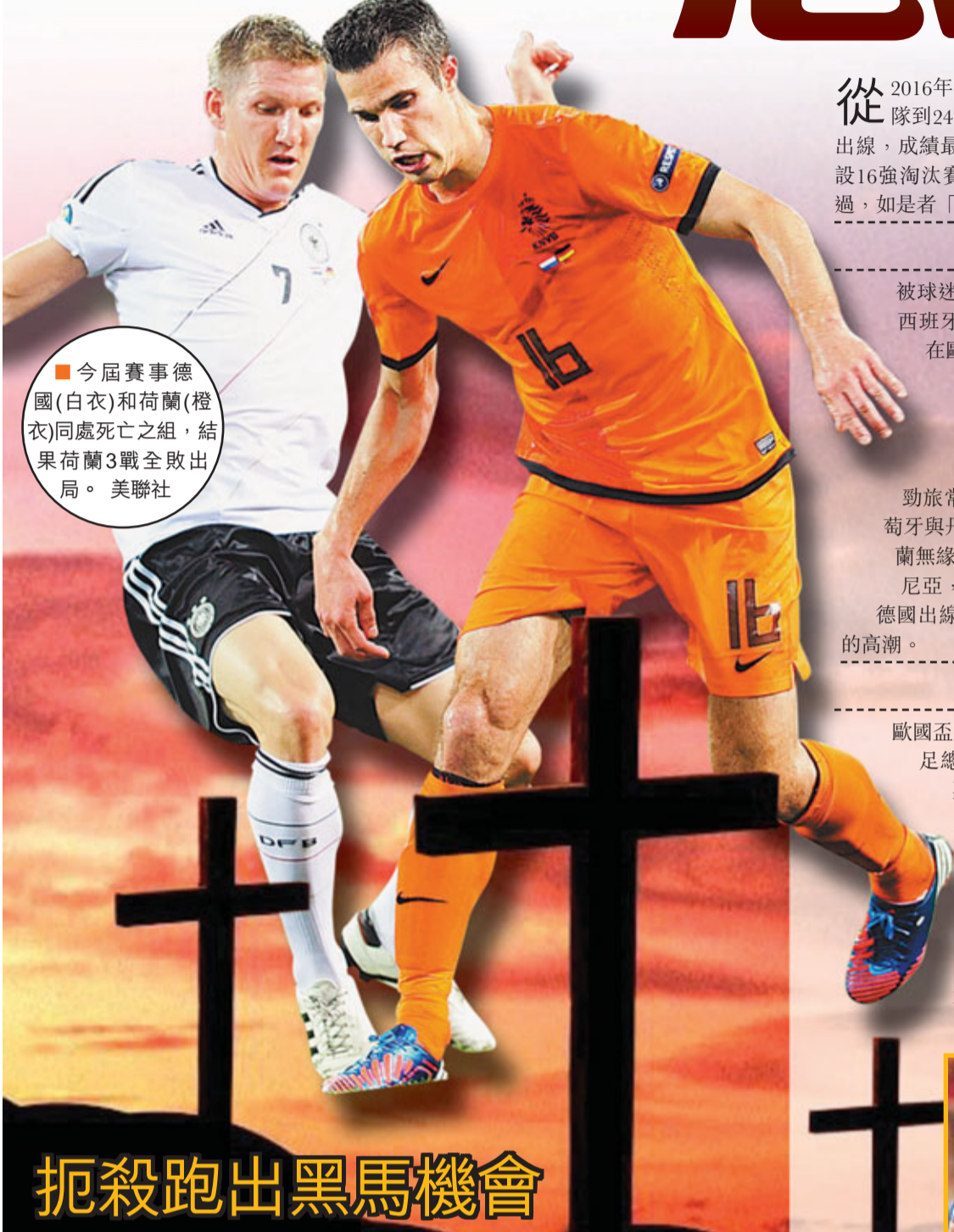
●今屆賽事德國(白衣)和荷蘭(橙衣)同處死亡之組，結果荷蘭3戰全敗出局。

從2016年法國歐國盃開始，參與決賽周的球隊會增加8隊到24隊，他們將平均分到6個小組中，每組首兩名出線，成績最好的4支小組第3名球隊亦會晉級，之後會首設16強淘汰賽，繼而現行的8強、準決賽以及冠軍戰。不過，如是者「死亡之組」便會很難再出現。