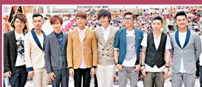
英皇群星在大球場舉行的《七·一大匯演》演出。