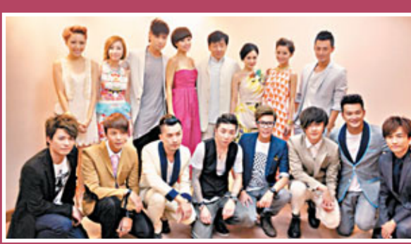
成龍、古巨基、容祖兒、Twins、林峯等一班英皇歌手出席大球場回歸大匯演後合照。

歌曲《友共情》例必大派用場，他說：「這首歌很多場合都適合。」新特首梁振英上場，基仔謂：「希望多關注樓價過高，現時的樓價比起97年更瘋狂，過分高企會影響民生。」有指基仔手頭的物業便「水漲船高」，他覺得要以大眾為調整依歸，不該從個人着眼，況且他在高價時購入，並非大家所說「賺好多」，他一個月前購入的舖位仍要慢慢供，經營時裝生意的基仔，覺得與其交貴租，不如「供」舖位，暫時先出租，因捱過貴租也是過來人，所以會給予人家一個合理租價。說到老闆楊受成豪送一個舖位給謝霆鋒，基仔謂：「沒有想過收這麼大的禮物，如果有的話便不會向老闆托手腳，(收過老闆最厚禮是什麼?)但話會包起我將來的婚宴，但我想低調，最怕大排筵席，所以心情有點矛盾，或者由我一個人食光，又或是分開慢慢食，可以食一世。」