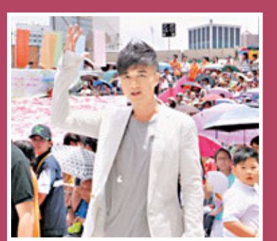
古巨基表示將來結婚想低調，未必大排筵席。