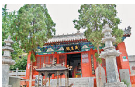
■古樸壯觀的天王殿，向來香火最旺。