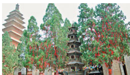
■來風穴寺拜佛的人，留下他們的虔誠和敬仰，為這座寺廟保留一份靈動之氣。