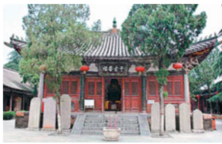
■古建築的巔峰之作——中佛殿。