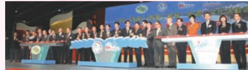
▲聯合開幕典禮儀式 ◀嘉賓合影

2011年12月4日至8日 ，本會假香港會展中心，與海南省人民政府聯合主辦「第十二屆世界海南鄉團聯誼大會、第三屆世界海南青年大會暨2011海南（香港）經貿、旅遊、文化活動周」，25個國家和地區5000餘名瓊籍鄉親出席。活動取得了圓滿成功，海南省外事辦主任吳士存先生高度評價是次盛會創下五個最：規格最高、規模最大、成果最豐、影響最大、意義最深遠。