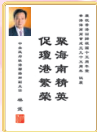
中央政府駐港聯絡辦副主任林武先生題辭