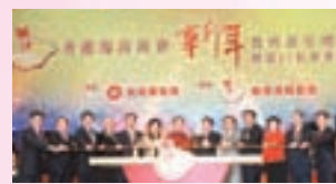
▲本會張學修會長、符傳軍常務副會長、陳明謙常務副會長陪同曾蔭權特首等主禮嘉賓共同舉行亮燈儀式

2011年 本會獲香港民政事務局煙花審核小組批准，以680萬港元之巨贊助辛卯年賀歲煙花，張學修會長為主要贊助人。