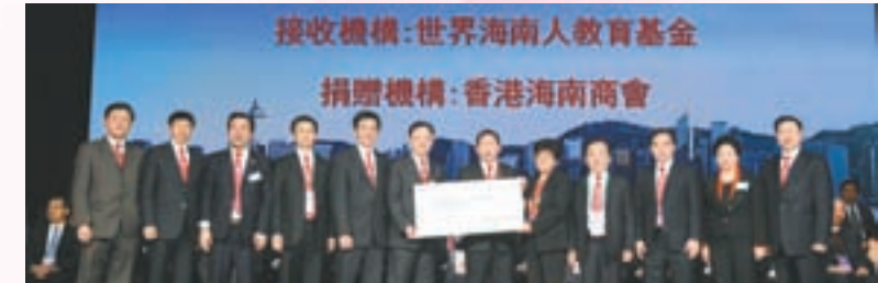
▲本會捐贈港幣壹佰萬元予世界海南人教育基金