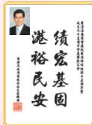
商務及經濟發展局局長蘇錦棟先生題辭