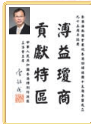
香港特區立法會主席曾鈺成先生題辭