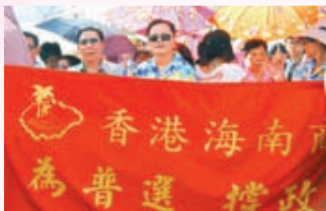
▶本會隊伍參加「為普選 撐政改」集會遊行活動時合影

2010年6月19日 ，由「政制向前走大聯盟」發起的「為普選 撐政改」集會遊行活動在香港維多利亞公園舉行，本會作為發起團體之一，積極組織會眾參加，以表達對政制發展的訴求和冀盼。