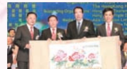
▲國務院僑務辦公室向本會贈送紀念品

2012年 本會部分文昌籍會董發起成立「香港文昌社團聯合會」，同時成立十九個鎮同鄉會，目前會員人數近15000人。