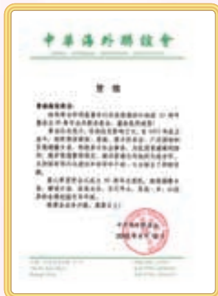
中華海外聯誼會賀信

2012世界海商論壇 論壇主題：共享新機遇——論新形势下的海商精神 合辦機構：香港海南商會、新加坡海南商會、海南省華商會 支持機構：香港文昌社團聯合會、廣東省海南商會、海南省僑商會、海南省企業聯合會、泰國海南商會 時間：14:30-17:00 地點：香港會議展覽中心「演講廳」（舊翼二樓） 聯歡宴會 時間：19:00-21:45 地點：香港會議展覽中心「會議廳」（舊翼二樓）