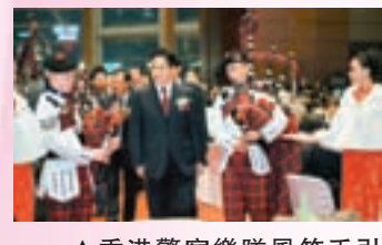
▲香港警察樂隊風笛手引領主禮嘉賓進場