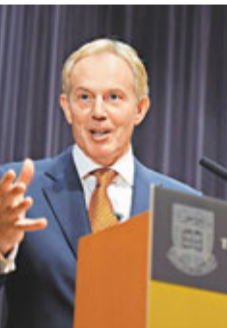
貝理雅上月在香港大學演講。