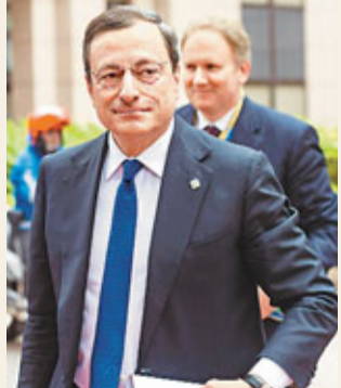
德拉吉會否支持救市基金買債，左右市場情緒。

水，圖推展創新高的意大利及西班牙債息。不少專家估計，央行為進一步穩定市場情緒，可望推出一輪流動舉措或減息至0.75厘，以支撐主權債市，否則將令危機急劇惡化。