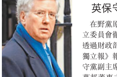
法倫的角色有利益衝突之嫌。網上圖片

英國巴克萊銀行(左圖)涉嫌操縱倫敦銀行同業拆息(Libor)事件愈鬧愈大，甚至引起美國聯邦調查局(FBI)關注，介入調查。英國當局昨日宣布由財政部獨立委員會對Libor進行重新審查，巴克萊總裁戴蒙德亦被要求出席，有巴克萊股東發起行動，要求將戴蒙德及主席阿吉厄斯下台。