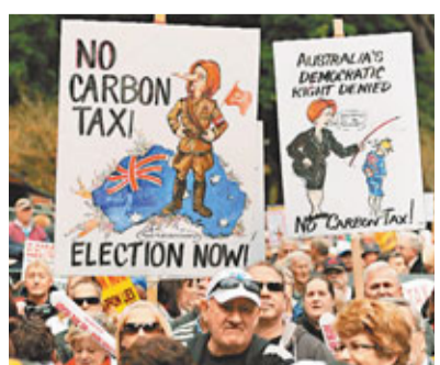
悉尼民眾示威反對徵稅。

澳洲政府昨日加入歐盟與新西蘭行，開徵備受爭議的碳排放稅，以減少溫室氣體排放，紓緩氣候暖化。澳洲約350家碳排放嚴重的企業，每排放1噸二氧化碳須繳付23澳元(約183