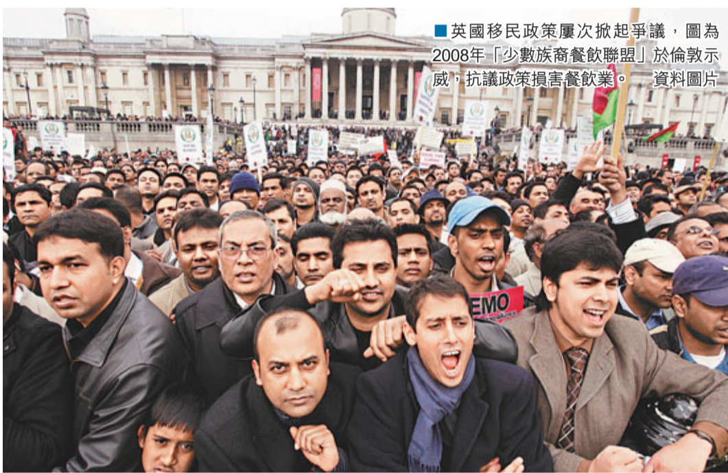
英國移民政策屢次掀起爭議，圖為2008年「少數族裔餐飲聯盟」於倫敦示威，抗議政策損害餐飲業。資料圖片