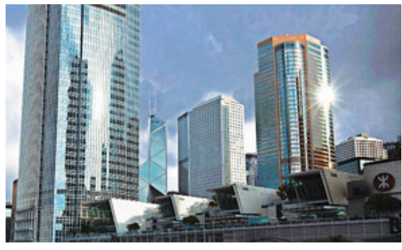
香港企業女董事比例在亞太區排名第二。資料圖片

國際調查機構麥肯錫公司昨日公布最新報告顯示，亞太區女性身居上市公司行政職位的比例只有8%，落後歐美地區的10%及14%，董事會中女性比例差更大，麥肯錫形容數目低得令人吃驚。香港女董事的比例為9%，在區內排名第二高，澳洲及中國內地則分別以13%及8%排第一及第三。