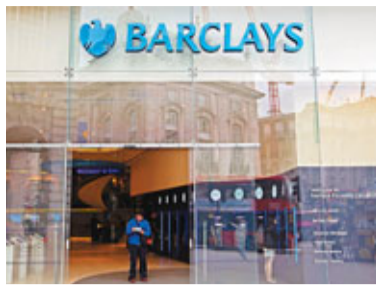
英國巴克萊銀行(左圖)涉嫌操縱倫敦銀行同業拆息(Libor)事件愈鬧愈大，甚至引起美國聯邦調查局(FBI)關注，介入調查。英國當局昨日宣布由財政部獨立委員會對Libor進行重新審查，巴克萊總裁戴蒙德亦被要求出席，有巴克萊股東發起行動，要求將戴蒙德及主席阿吉厄斯下台。