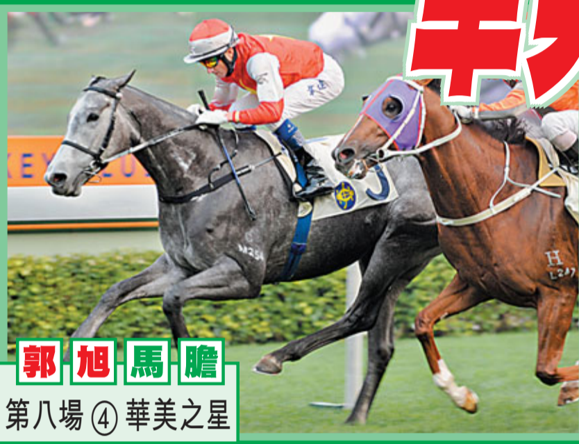
郭旭馬膽 第八場 ④華美之星

11 第三班、一八〇〇米 「飛翔星」上場初跑千八百米，直路追迫猶如天馬行空，纏鬥下不敵「財寶鷹」，純粹輪轉多少路程經驗，如今汲取過一次經驗再上，三班超級馬篤定補中。「百事神駒」上場初跑千八百米的表现亦好，可予前駒一定威脅。「喜來仙子」血統具長力，觀乎近仗千六米演出，攀上千八百米展望也應付得來，必須繼續兼顧。「靚好聲」當打輩正處飛躍期，依然難以輕視。