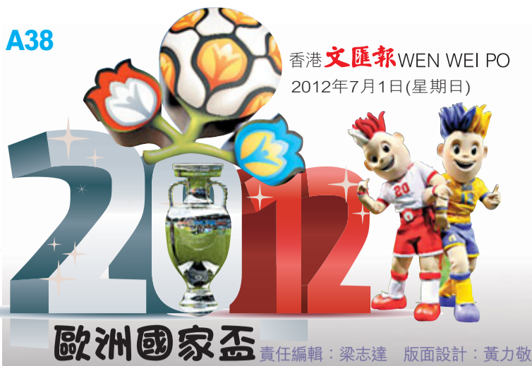
歐洲國家盃 責任編輯：梁志達 版面設計：黃力敏

2012年歐洲國家盃今晚深夜將在烏克蘭基輔奧林匹克球場爆發終極冠軍戰，衛冕冠軍西班牙被指失去了昔日的進取心，是役再次遇上分組賽對手意大利，面對克服假波醜聞越踢越好的「藍衣軍」其一面倒佔優的對賽往績，「狂牛」在創造「連霸」歷史前將要遇上終極難關。(無綫翡翠台、高清翡翠台，now100、630台、632、660高清台周一凌晨2:45a.m.直播)