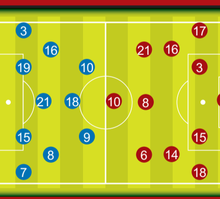
意大利預計正選陣容

派路——轉會祖雲達斯後即助球隊贏得意甲錦標的派路已88次為意國披甲，雖已33歲，但仍是球隊攻守核心，狀態上佳。分組賽罰球建功，對英格蘭互射12碼一記淡定「chip射」扭轉敗局，其致命傳球是意軍勝負關鍵。