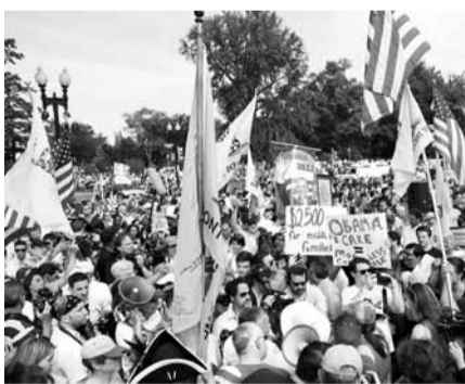
■反對醫保案的茶黨成員在最高法院外示威。 法新社

霍士主播起初亦稱法案被推翻，並在推特上發布消息，發現事有蹊蹺後刪除。兩大傳媒放「流料」，令所有傳媒和社交網絡陷入混亂。《時代周刊》和《赫芬頓郵報》引述CNN跟着出錯，後者承認轉載時「操之過急」。《紐約時報》則多花數分鐘分析裁決，故避免了報錯料。 ■美聯社