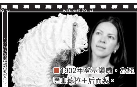
■1902年亞歷山德拉王后所製。