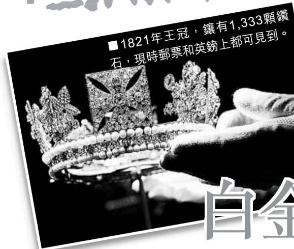
■1821年王冠，鑲有1,333顆鑽石，現時郵票和英鎊上都可見到。