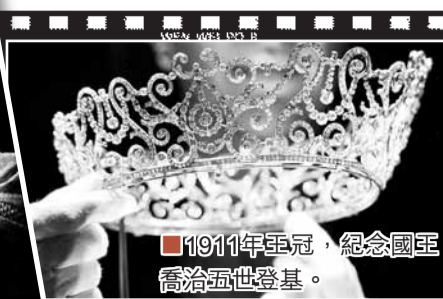
■1911年亞冠，紀念國王喬治五世登基。