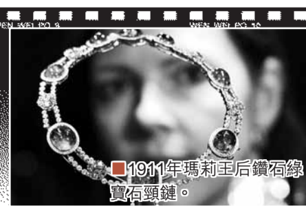
■1911年瑪莉王后鑽石鑲寶石頸鏈。