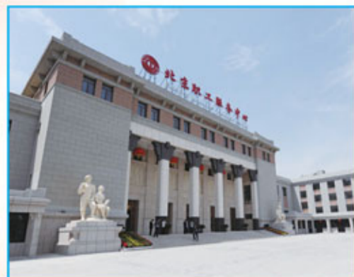
北京職工服務中心是創新工作的具體體現

工提供技能培訓,還為各類技能人才提供了一個交流的場所。 探索和創新節日文化品牌 通過一些新的探索和創新打造出勞動者的節日文化品牌。活動內容主要分三個層次:社會公共文化服務項目——職工持「京卡·互助服務卡」可以在市屬十大公園享受贈票和半價的優待,可以在全市77家影院享受優惠或免費觀影服務;市級工會文化服務項目——市總工會文化服務陣地為持卡職工提供文藝表演、體育健身、觀影、觀覽、讀書、培訓等免費或優惠服務;基層工會文化服