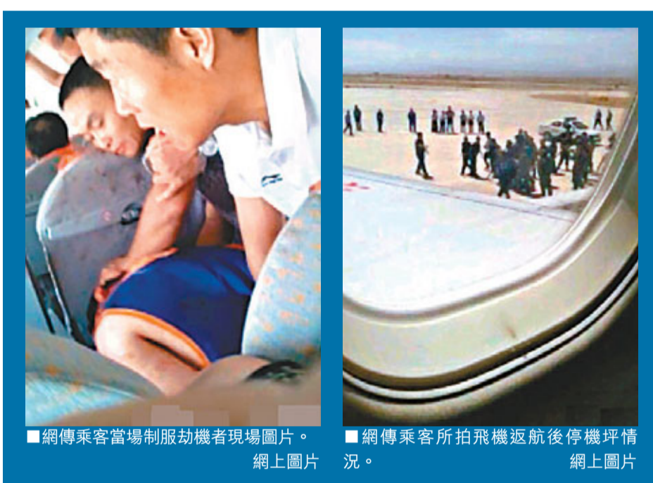
網傳乘客當場制服劫機者現場圖片。網上圖片

管制非常嚴格,私家車、的士都不讓進入。他在聽說發生劫機事件後表示,近兩年來,新疆各方面快速發展,19省市支援新疆,為新疆帶來跨越式發展。政府也特別關心民生問題,現在新疆整個社會需要非常穩定的環境,需要民族團結和各民族和睦相處。