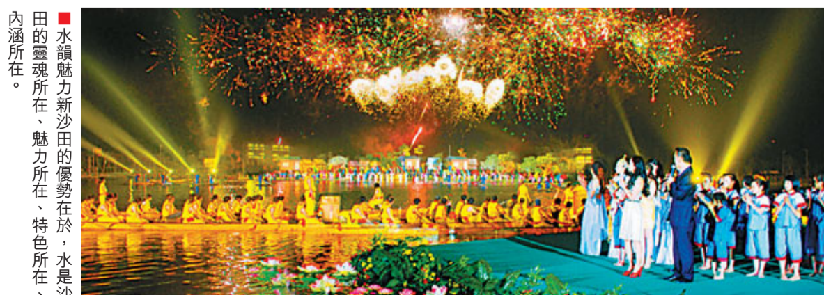
水韻魅力新沙田的優勢在於，水是沙田的靈魂所在，魅力所在，特色所在，內涵所在。

沙田未來五年將側重發展先進裝備製造業、現代物流服務業、高端新型電子信息產業、節能環保產業和海洋產業等五大產業，着力培育一兩個重點支柱產業，力爭形成主導產業突出、相關產業發展、產業鏈條完整的具有沙田特色的智慧型、高端型、環保型現代產業體系。