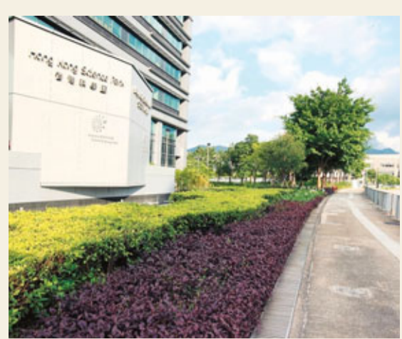
香港科技園助高技術企業北拓內地市場。圖為香港科技園一角。

香港文匯報訊 (記者 涂若奔) 創新科技產業一直是港府倡導的六大產業之一，但發展步伐卻不盡人意。究其原因，楊德斌認為是港府投入不足，加上政策未有重點扶持所致。他認為，香港應切實做好科技產業，力爭在未來10-15年，將其對GDP的貢獻佔比提升至5-10%，才能符合長遠發展需要，建設成「多元化、知識經濟型」的國際大都會。