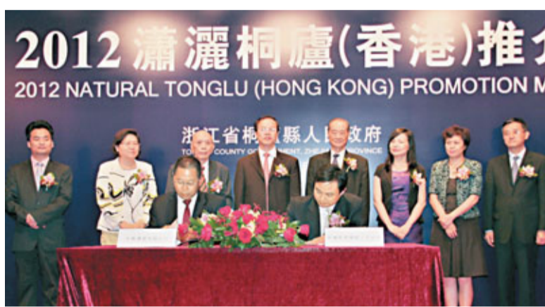
桐廬在港推介會簽約現場。