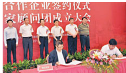
北京環渤海高端總部基地與協信集團簽約戰略合作協議。