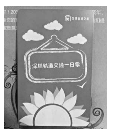
深圳地鐵一日通票價20元。