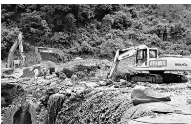
搶險人員在四川涼山州寧南縣泥石流災區用機械搶通被沖毀的道路。新華社

另訊(香港文匯報實習記者 黎玉嬌 綜合報導)27日下午,貴州省民政廳減災委發佈消息稱,連日來的暴雨洪澇已造成貴州省43個縣(市、區)80.5萬人受災,全省直接經濟損失8,600餘萬元。