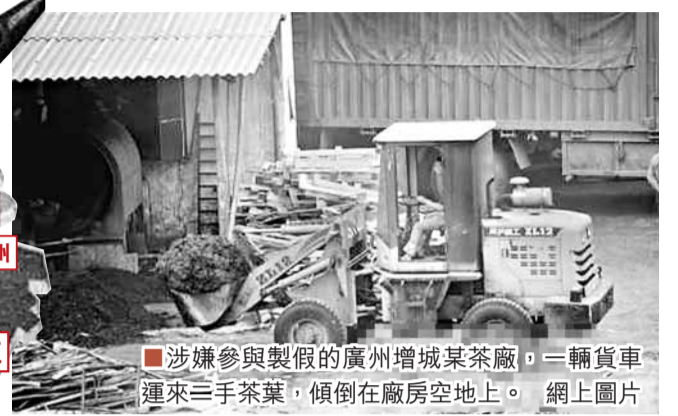
涉嫌參與製假廣州增城某茶廠,一輛貨車運來二手茶葉,傾倒在廠房空地上。