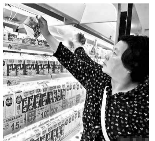
顧客在上海一家超市內選購小包裝光明牛奶。

上海市質監局表示,已要求光明乳業及時報告相關的處理情況,同時抽取了25日生產的光明優倍牛奶送檢,並提醒消費者停止食用25日生產的950毫升優倍牛奶。