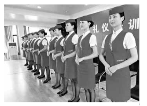
龍廈鐵路上的「動姐」準備上崗。網上圖片

龍廈高鐵客運里程169公里,設計時速200公里,全線運行時間約90分鐘,共設龍巖、馬坑、龍山鎮、南靖、草坂、漳州、角美、東孚、前場、廈門北等10個車站。這是目前內地21個革命老區中唯一一條高速鐵路。南昌鐵路局黨委副書記馮軍表示,龍廈