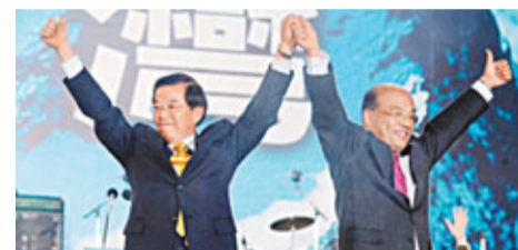
蘇貞昌(右)與謝長廷曾參與2008年「大選」。

談到與蔡英文關係，蘇貞昌形容，像上次與謝長廷會晤完，有被好事者撥弄；他把話鋒一轉，提到2008、2012兩個大選，外界會看到不一樣的蘇貞昌。他過去你罵我，我就罵回去，但這樣不一定高明。