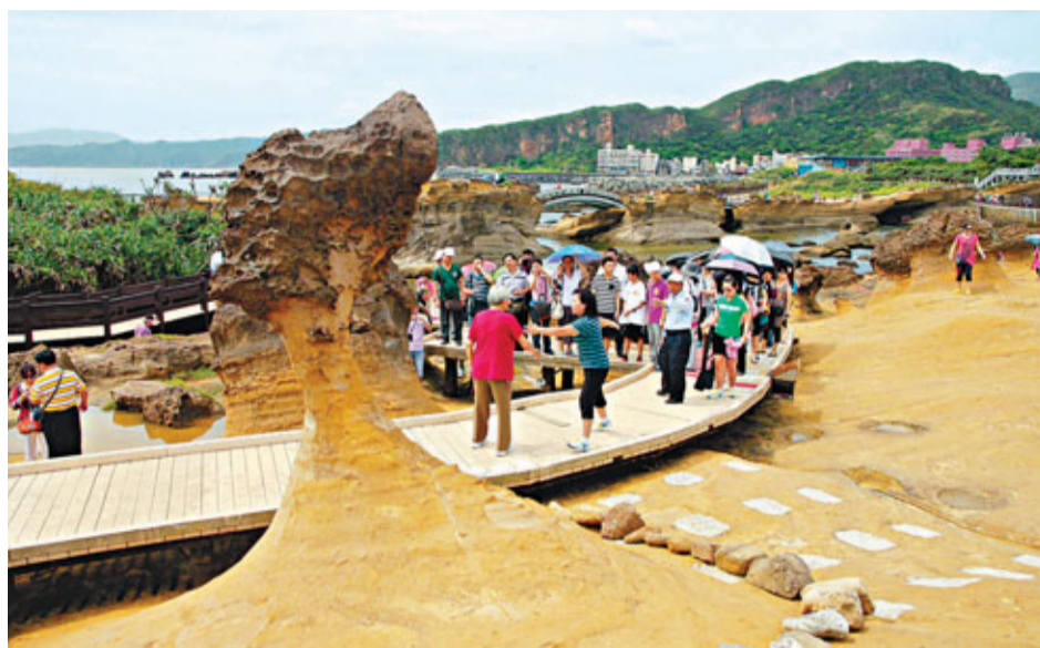
大陸旅行團在野柳女王頭合影留念。

據業內人士指出，陸客個人遊的人數還不多，主要是因為辦證的程序繁瑣。台灣海基會董事長江丙坤27日表示，開放個人遊帶來利多，預估大陸今年來台旅客將超過200萬人次，他呼籲兩岸繼續努力，尤其應簡化簽證手續，為台灣帶來更多商機。 另一方面，台灣旅行商業同業公會全