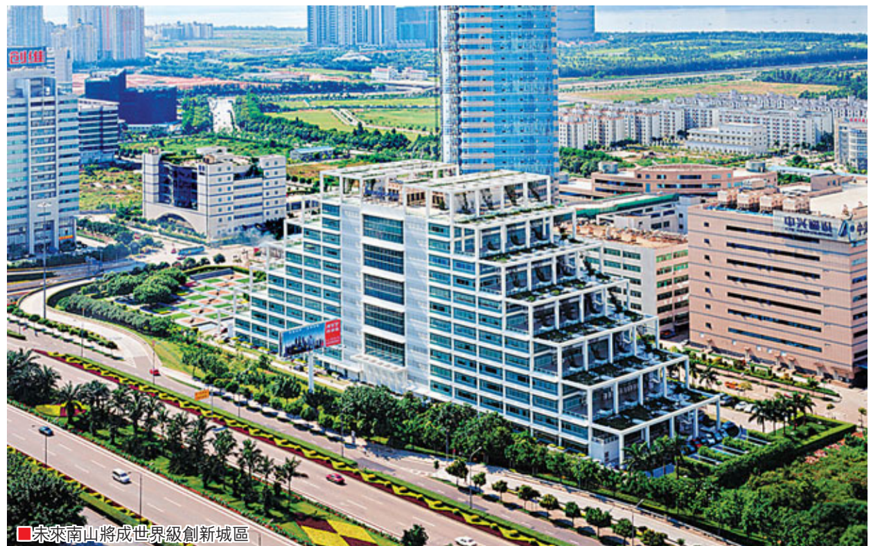
未來南山將成世界級創新城區

其他四大增長極，一是華僑城創意文化產業區，是深圳市11個戰略性新興產業聚集區之一，華僑城歡樂海岸建設全面啟動，將成為南山旅遊休閒文化的新地標；二是後海總部基地，其中華潤國內總部和華潤萬家總部已進駐，華潤集團預計「十二五」期間實現銷售額5600億元、利潤820億元；三是新蛇口片區，其中「蛇口網谷」建成後，年產值將達300億元以上，「蛇口太子灣郵輪母港」工程已動工建設，建成後，預計南山旅遊量每年將增加180萬人次，帶來的經濟收益將達150億元人民幣；四是前海深港現代服務業合作區，前海作為廣東省轉型升級的三大發動機之一，將聚集高端現代服務業的企業，到2015年預計實現GDP500億元，2020年將高達1500億元，實現每平方公里GDP高達100億元，成為引領全國現代服務業發展的標杆和典範。