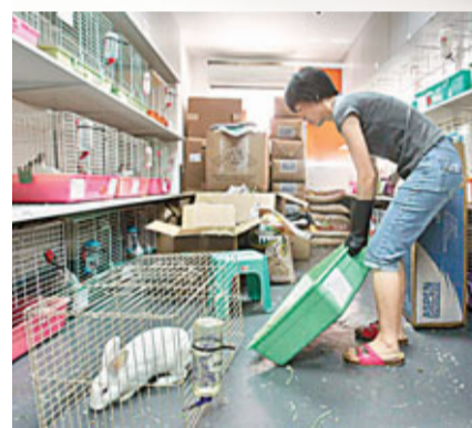
■義工在兔協為兔餵草添水。

香港兔友協會乃全港唯一一間致力於為兔謀取福利的無政府資助機構協會，並已於6月9日正式遷往新址：九龍旺角塘尾道60-62號福康工業大廈5樓02室 官方網頁： http://www.hkrabbit.org/