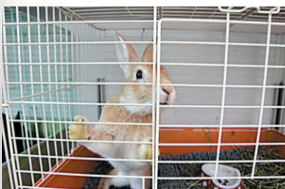
■每一隻棄兔背後，都有一個故事。