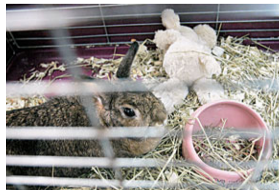
■棄兔在香港兔友協會