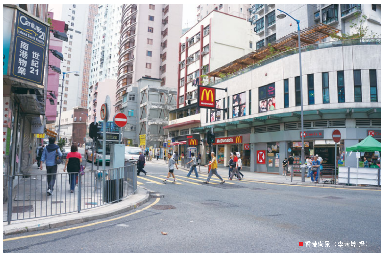
■香港街景