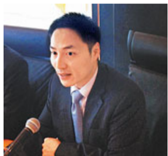
歐債與預期,下半年新股市場將回暖。

香港文匯報訊(記者 劉璇) 德勤發布本港新股市場報告顯示,受歐債危機等影響,上半年本港首次公開招股(IPO)項目32宗,集資總額僅306億元,較去年同期1,872億元的集資額暴跌84%,創2009年金融海嘯以來最慘淡的中期表現。以集資額計,本港新股集資額上半年排名全球第五。展望下半年,德勤料IPO市場將回暖,集資額最多可達1,300億元。但全年計,集資額或較去年的2,700億元大減40%。