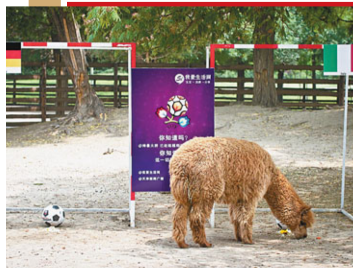
今屆歐國盃「9猜8中」的中國天津「神獸」羊駝「大胖」，認為意大利會淘汰德國。