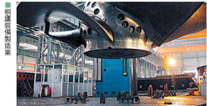
桐廬新能源製造業