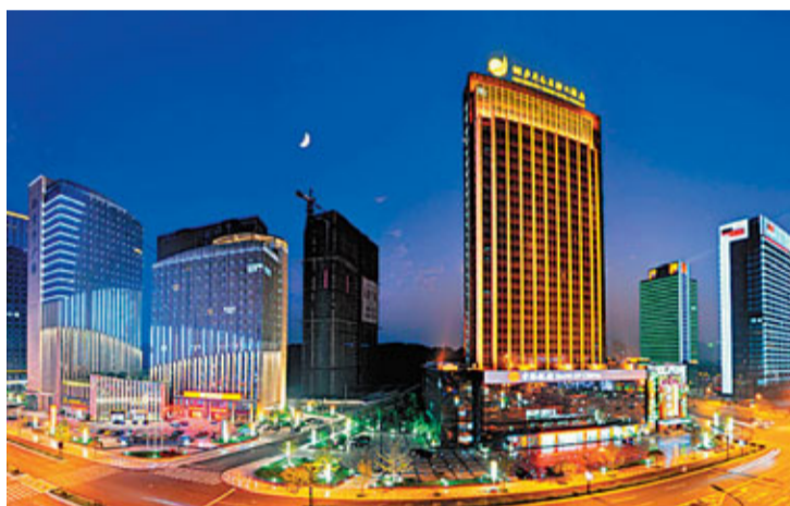
桐廬迎春商務區夜景

捷、貼心的行政審批服務和優越的投資環境讓桐廬成為投資熱土，還吸引了東芝、通用、松下等世界500強企業投資項目，澳門勵駿國際等一批高星級酒店，杭州商學院、浙江樹人大學、浙江女足訓練基地等項目正在落戶，為桐廬的發展增添了生機和動力。