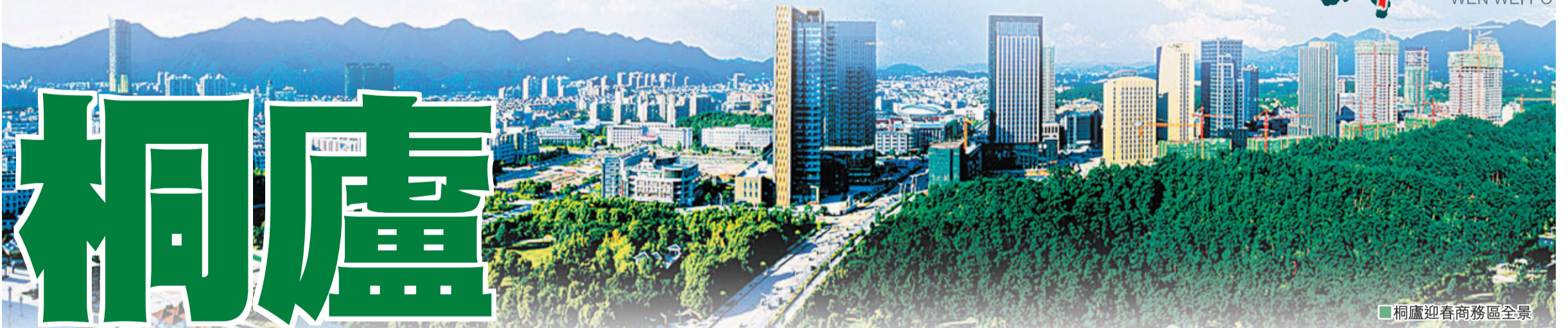
桐廬迎春商務區全景