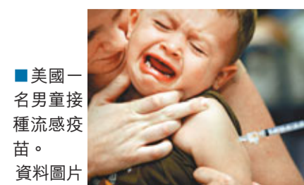
■美國一名男童接種流感疫苗。資料圖片

洲的估計死亡率也計算在內，得出甲流恐奪走多達28.45萬人性命，是世衛數據的15倍。研究報告的主要撰寫人、美國疾病控制及預防中心的達烏德說，這是首個估計全球甲流死亡人數的研究。病理學家及醫生依據人口和死亡個案估計，製作出一個統計模式，揭示甲流疫情更準確的情況。