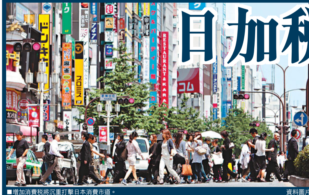
■增加消費稅將沉重打擊日本消費市道。資料圖片