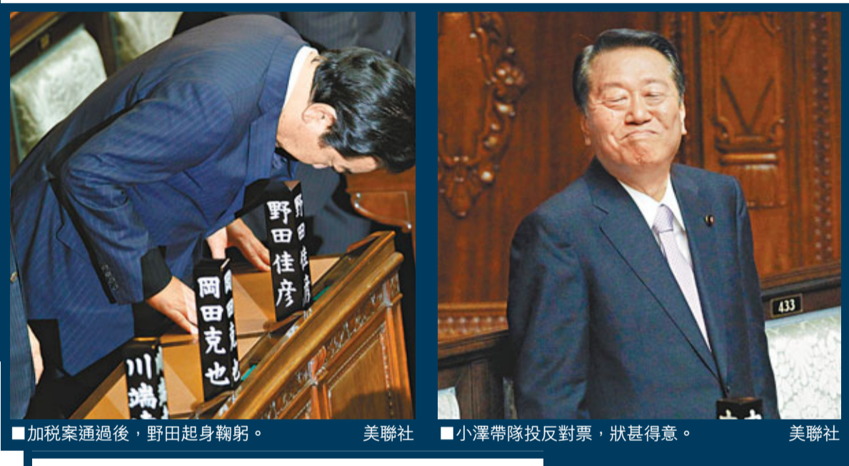
■加稅案通過後，野田起身鞠躬。