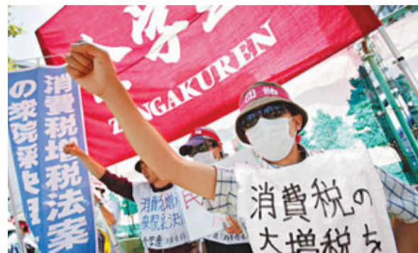
■東京民眾在國會外示威，反對加稅。