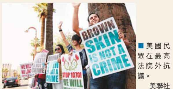
■美國民眾在最高法院外抗議。美聯社