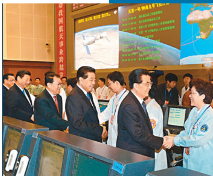
■胡錦濤、賈慶林、李長春、習近平、李克強在北京航天飛行控制中心親切看望工作人員。

通話結束後，胡錦濤、賈慶林、李長春、習近平、李克強等中央領導來到飛控大廳的現場工作人員中間，同他們一一握手，並親切勉勵參研參試人員再接再厲，奮力奪取載人交會對接任務全面勝利。