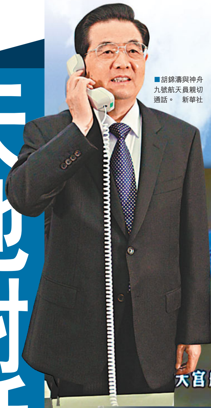
■胡錦濤與神舟九號航天员親切通話。