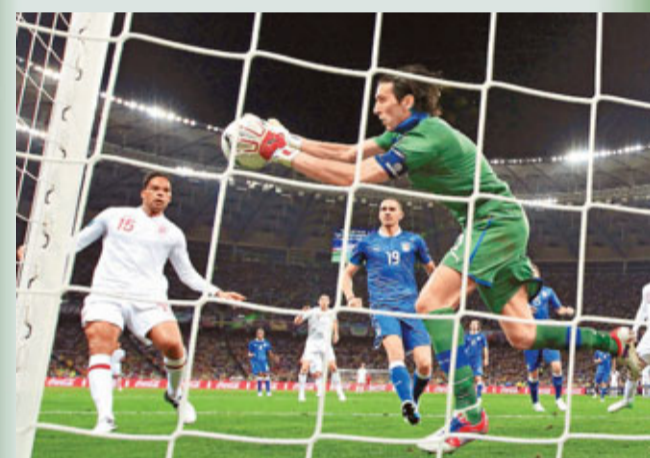
■保方開賽初段救出險球。