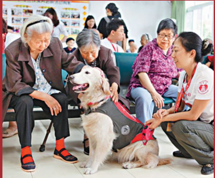
25日，成都四隻「狗醫生」來到簇橋鎮佛村養老院「出診」。圖為「狗醫生」淡定接受老人的愛撫。