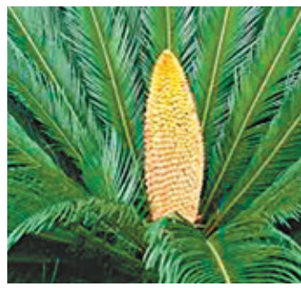
鐵樹開花是難得一見的自然現象。

側，主幹上大小不一，最大處直徑達50cm以上。葉叢分四組環生，花苞也分四處萌發。與之同時開花的鐵樹共有4棵。它們分列在大門內的左右兩邊，對稱排列，株高大小大致相同。除了前述的這棵開了4朵花，另一棵還開了兩朵並蒂的。