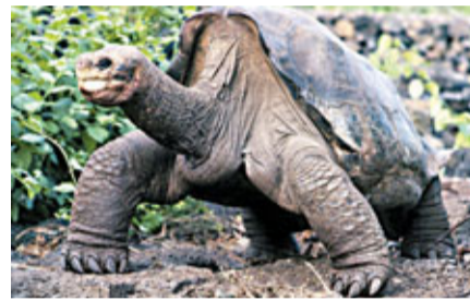
■「寂寞喬治」於2001年的照片。

南美洲厄瓜多爾海岸1,000公里外的平塔島上，保育龜種「寂寞喬治」(Lonesome George)前日與世長辭。隨着這個據估計年逾百歲的保育象微離世，又一物種從地球永遠消失。