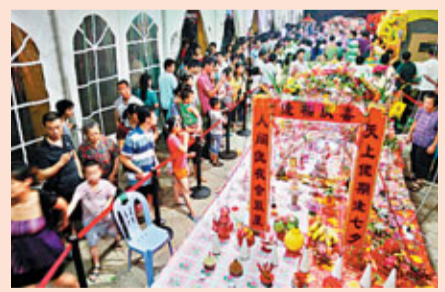
■遊客在品嚐美食的同時亦可欣賞民間文化藝術展演

美食文化節期間，道滘還與各大旅行社合作，充分整合粵粵園、諾華中國傢俱博物館、兒童樂園、華南茶業市場等旅遊資源，並與東莞市內其他著名景點形成互動，聯合推出多條美食文化節旅遊線路。今年的活動保留了往年的精彩節目，比如場面宏大的開幕式和閉幕式、秉承傳統的遊龍趁景活動、放蓮花燈及龍舟聖水活動、玩龍舟聖水等。此外，還增設了嶺南水鄉烹飪文化展示長廊和民間文化藝術展演。搭建仿古廚房實景，展示各種烹飪器具和飲食器具，展現嶺南水鄉的飲食特色、飲食風俗等；邀請粵劇團、歌舞團、雜技團演出，並對龍舟及七夕貢案製作、茶藝等民間藝術進行集中展演。