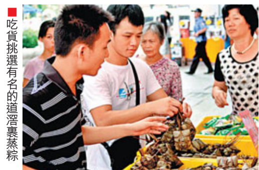
■吃貨挑選有名的道滘裹蒸粽

活動好戲連台，商貿交流熱烈活躍。劃分了道滘美食區、國內美食區、國際美食區、港澳台美食區四大展區，網羅廣州「早八點」、深圳合口味、東莞花園粥城等知名食企酒樓美食；道滘鎮傳統的蟛蜞鹹扒、道滘裹蒸粽、道滘肉丸、炒米餅等地方特色美食，石龍「李全和」麥芽糖柚皮、中山石岐乳鴿、潮汕手打牛肉丸、羅浮山山水豆腐花等珠三角美食；以及意大利手工冰淇淋、越南皇室咖啡、越南海產品、韓國柚子茶、韓國生薑茶等中外馳名美食；還有香港金富士、chia奇亞食品、優之良品、台灣一口蟹、澳門十月初五餅家等港粵台品牌美食。