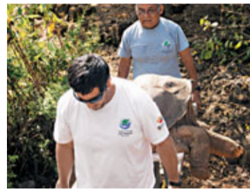
■工作人員運走屍體。