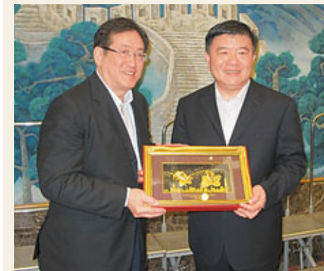
■周一嶽昨日在北京拜會國家衛生部部長陳竺。圖為周一嶽(左)與陳竺交換紀念品。

香港文匯報訊(記者 鄭治祖) 香港食物及衛生局局長周一嶽在接受《廣州日報》專訪時表示，在供港食物方面，國家質檢總局、廣東省都做了很多工作，現在供港食品的安全率達到了99.999%，這在全世界都是很難得的。