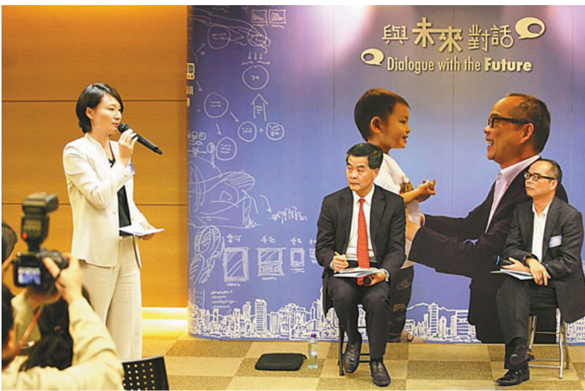
■梁振英昨出席民建聯舉辦的「與未來對話」座談會，劉江華、李慧琼、葛珮帆等均有參與。

被問及會否重推公屋租置計劃，他說需要總結過去的經驗，包括租置計劃引起的管理問題，及樓宇老化後如何處理等。梁振英強調，受外圍經濟問題影響，新屆政府在處理樓價問題時必須謹慎，「所有房屋政