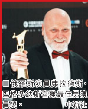
俄羅斯演員弗拉德斯·巴格多納斯獲最佳男演員獎。