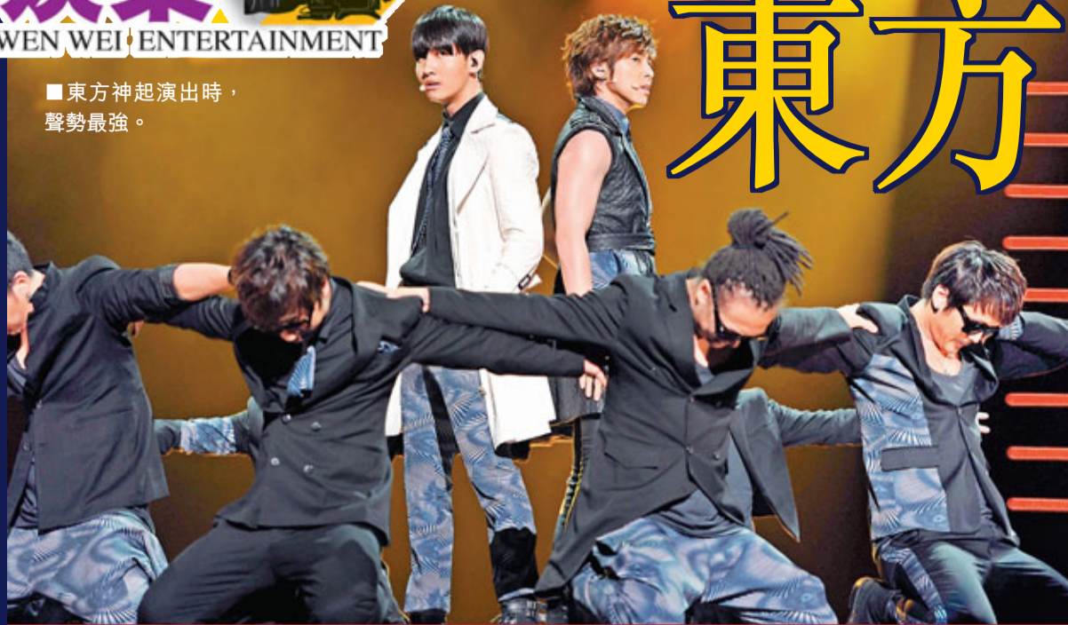
東方神起演出時，聲勢最強。

香港文匯報訊 (記者 陳敏娜) 前晚8個韓國單位東方神起、Wonder Girls(WG)、CNBlue、f(x)、BEAST、IU、Infinite及MBLAQ在亞洲國際博覽館Arena參與「Music Bank世界巡迴演唱會香港站」演出，其中CNBlue隊長鄭容和唱出港產片《玻璃之城》主題曲《Try to Remember》，而f(x)則以中文、韓文及英文3種語言唱出《甜蜜蜜》，令演出增添香港風味。壓軸出場的東方神起最受歌迷熱捧，他們更落實於明年初來港開騷，再會港迷。