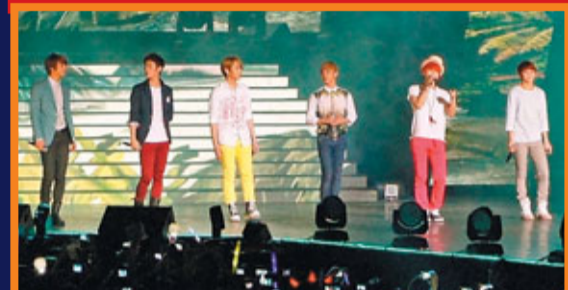
BEAST夏日打扮唱《花樣男子》主題曲。