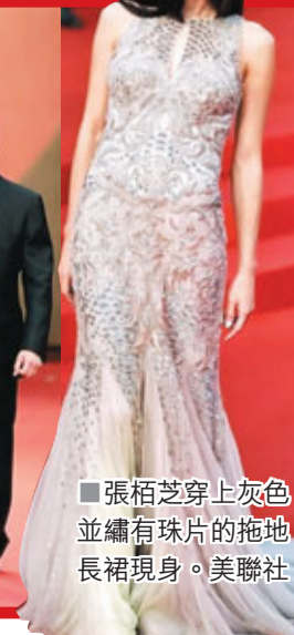
張栢芝穿上灰色並繡有珠片的拖地長裙現身。