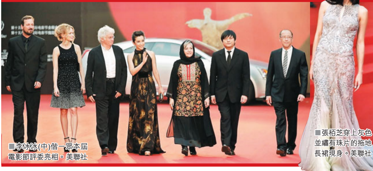
李冰冰(中)借一眾本屆電影節評委亮相。