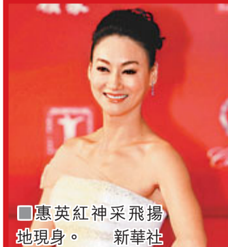
惠英紅神采飛揚地現身。