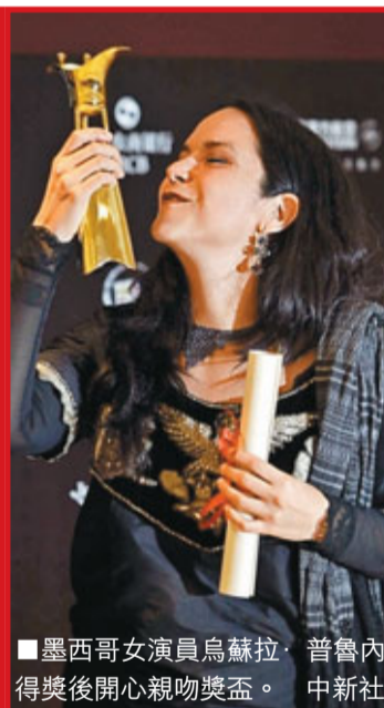
墨西哥女演員烏蘇拉·普魯內達得獎後開心親吻獎盃。