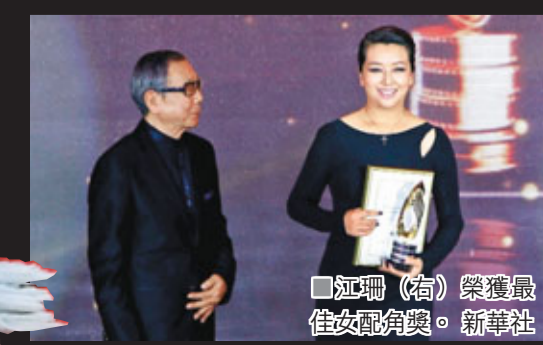
江珊(右)榮獲最佳女配角獎。

惟在最佳導演的評選中，傳媒大獎依然更為偏向新人。本次電影節傳媒大獎的最佳導演是《百萬巨鱷》的導演林黎勝，馮小寧導演的《甲午大海戰》則斬獲份量極重要的最佳影片獎。