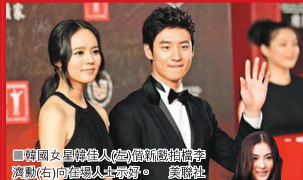
韓國女星韓佳人(左)借新戲拍檔李濟勳(右)向在場人士示好。