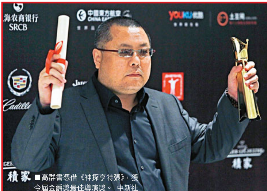
高群書憑《神探亨特張》，獲今屆金爵獎最佳導演獎。

不過，坊間與業界對於金爵獎的異議，近年來卻從未停止。有業內人士就指出，上海國際電影節更像一个國產電影的大賣場，吸引了幾十個劇組蜂擁至上海銷售及宣傳影片。但本應最受關注的主競賽單元卻乏人問津，歷年捧得金爵獎的外語影片在中國國內根本談不上任何影響力，也沒有片方在領獎禮後有意引進國內放映。