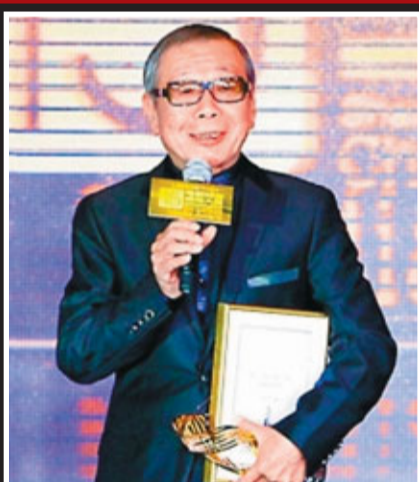
午馬成為媒體記者眼中的影帝。

香港文匯報訊(記者 章蘿蘭 上海報道) 上海國際電影節23日晚率先揭曉傳媒大獎，香港演員午馬憑借在《畫聖》中的精彩表演，將最佳男主角的桂冠收入囊中。1987年，午馬因在《倩女幽魂》中飾演道士燕赤霞而大受好評，更借此獲得台灣金馬獎最佳男配角獎，此番卻是他從藝40年中首度問鼎最佳男主角。曾被喻為「金牌龍套」的午馬在領獎時激動地表示，25年前他曾拿過獎，興奮過一回，沒想到25年後又讓他興奮了一回，希望再過25年，能再拿一個獎。