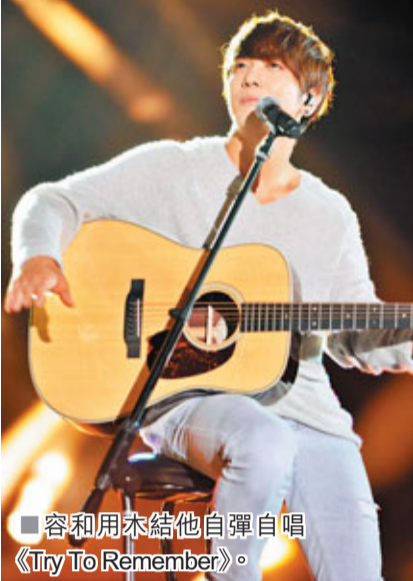
容和用木結他自彈自唱《Try To Remember》。

壓軸登場的東方神起一現身，現場大半歌迷馬上揮舞紅色熒光棒，引爆一片紅海。他們用中文喊歌迷，直言：「你們想我嗎？我都想你們呀。」他們透露曾聽Super Junior (SJ)說過港迷很熱情，加上SJ和少女時代都曾來港開騷，令他們都很想舉辦港騷，而他們的心願明年初就可達成，因他們已落實明年2、3月在港舉行演唱會，屆時必可再引爆多次紅海。安歌時，所有歌手再度出場唱出韓國民謠《阿里郎》及《Run To You》才結束個唱。除東方神起於昨天離港外，其餘歌手都於演出後馬上搭機返韓。