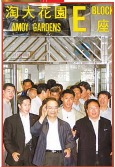
■國務院總理溫家寶，「零保護裝備」、「零距離接觸」，居民大為感動。 資料圖片