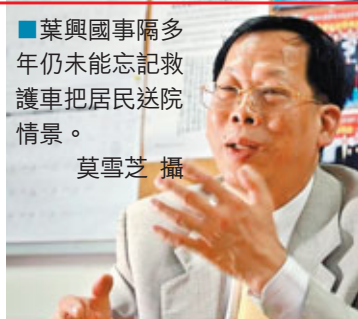
■葉興國事隔多年仍未能忘記救護車把居民送院情景。