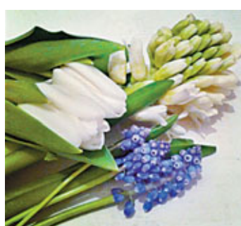
■鮮花就如原始鑽石，需經恰到好處的打磨才會發亮發光。鬱金香（左）、風信子（右）、葡萄風信子（下）。

文：Henry Leung （面書：Whim W-him；微博：Henry_Whim；電郵：whim@live.hk）