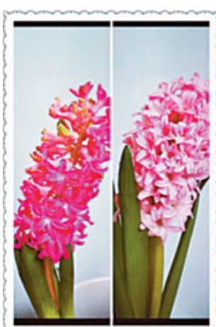
■花藝師能準確地指出兩花之別，為客戶把關。