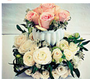
■「蜜月」by Whim，優秀的花藝創作都是花藝師的心血。