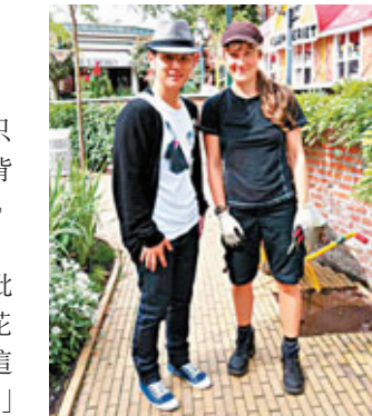
■筆者於哥本哈根與園藝師交流「護花」心得。