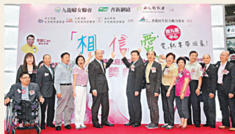
■嘉賓為「相·信·愛」活動啟動儀式。