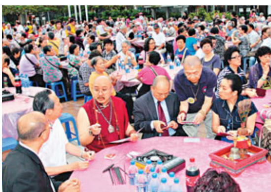
■嘉賓出席元朗天水圍千人宴。

「世界祥和千人宴」將於9月延續至美國加州舉行，到時將會是加州最大型的千人宴，免費接待對象亦將是當地的長者社區。