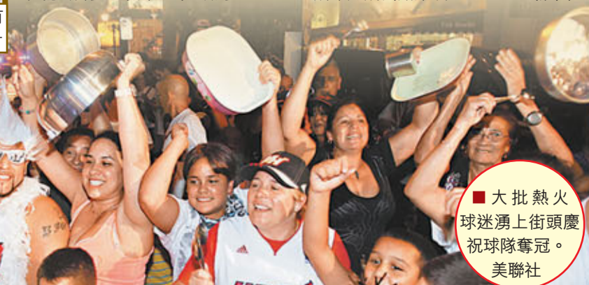
■大批熱火球迷湧上街頭慶祝球隊奪冠。