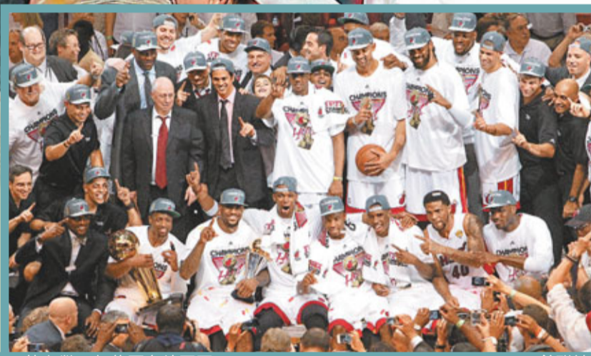
■熱火繼06年後再奪總冠軍。

苦等9年，夢寐以求的總冠軍，這夜終於落在「大帝」勒邦占士手中。在周四的第5場總決賽中，占士獨取26分、11個籃板球和13次助攻的「大三元」成績，率領熱火在主場以121:106大勝雷霆，以總場數4:1，贏得球會史上第2個總冠軍，而占士經過3次衝擊，終於一圓夙願，初嚐總冠軍滋味，賽後「大帝」還被選為總決賽MVP，包攬今季常規賽和總決賽MVP兩大榮譽，賽後占士高興地說：「我的夢想現在成真，這是我有生以來最好的感覺。」