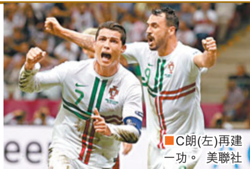
今仗葡隊全場20次射門5度中目標，捷克隊兩次射門卻全部不中龍門。球隊技術不及葡軍，球員只能憑藉壓逼性踢法破壞對方中前場組織，但不斷的跑動導致球員體能嚴重消耗，他們部分球員年齡偏大，最終後勁不繼，比賽末段失守。

這位西甲皇家馬德里球星賽後說：「我們今天控制了比賽，創造了許多機會，正因如此才有我的入球。我們踢得比分組賽時好多了。」