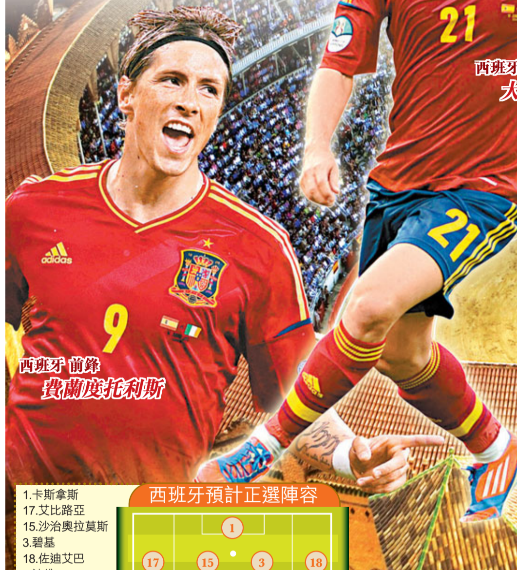
西班牙中場 大衛施華