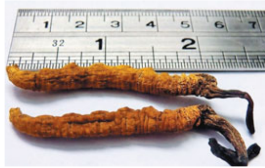
■ 頂級冬蟲夏草長達二吋半。

另外，不要貪便宜的便宜，例如有些店給你優惠，「買滿幾多兩，多送一兩」。試想，一兩冬蟲夏草的價錢上萬元，會有這麼便宜的事麼？有些店打個折扣還比較合理。