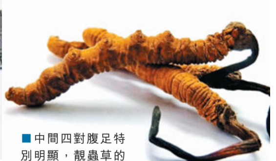
■ 中間四對腹足特別明顯，靚蟲草的子座特別長。