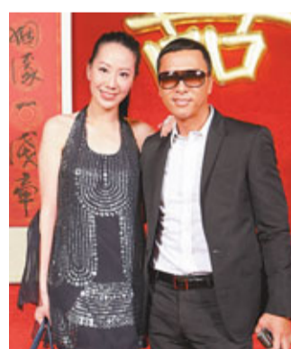
汪詩詩和甄子丹結伴到賀。