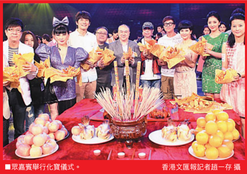
眾嘉賓舉行化寶儀式。