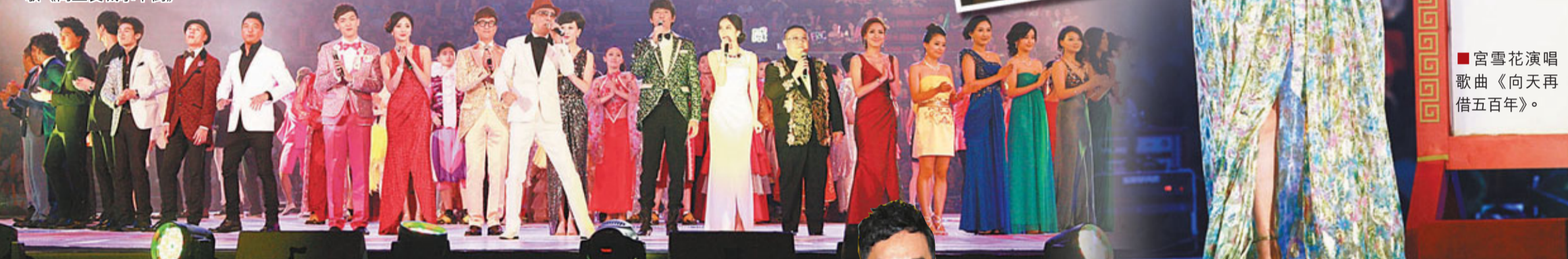
一眾亞視藝員台上表演時裝騷。