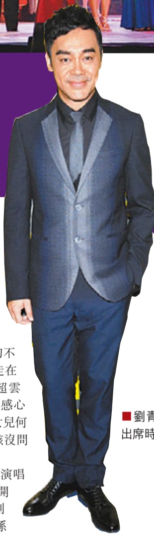
劉青雲西裝筆挺出席時裝活動。