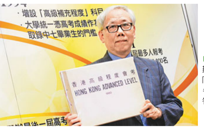
1980年首屆高考准考證。