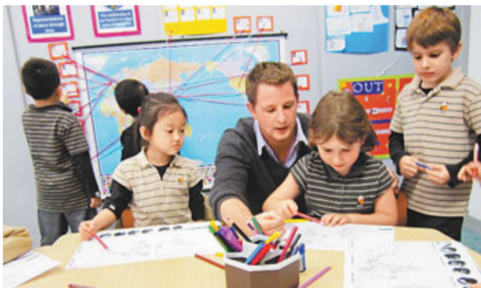
英基屬下啟新書院推「提名權計劃」，家長可以40萬元為子女購買優先面試及分配學位權利，圖為校內上課情況。

據了解，有意為子女申請於2013年8月入讀一年級的家長，而有意購買提名權者，可於本年9月1日至30日提出