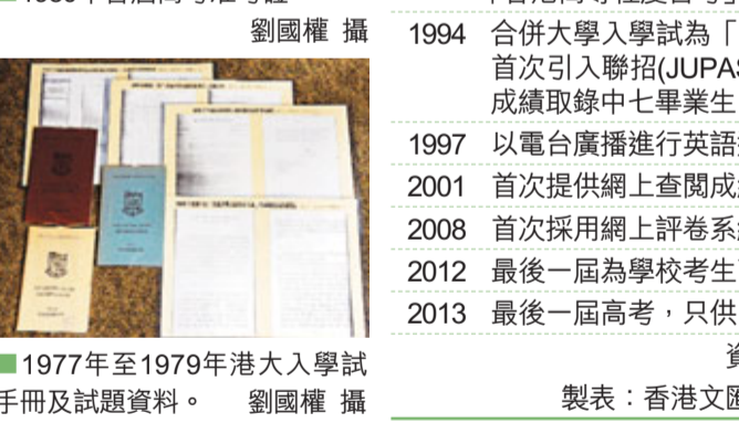
1977年至1979年港大入學試手冊及試題資料。