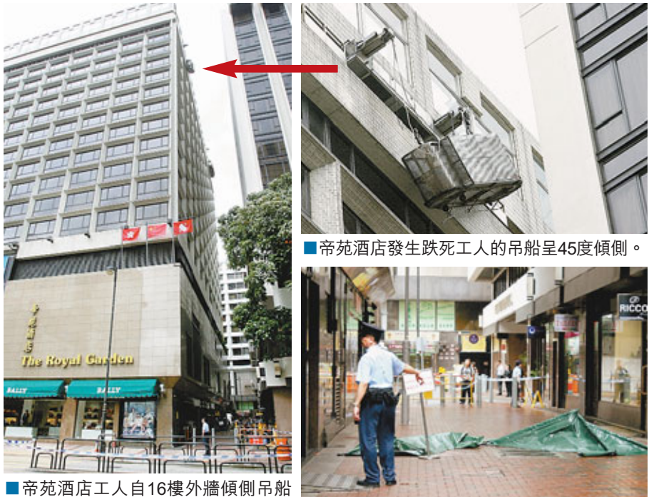
■帝苑酒店工人自16樓外牆傾側吊船直墮巷內身亡現場(箭嘴示)。