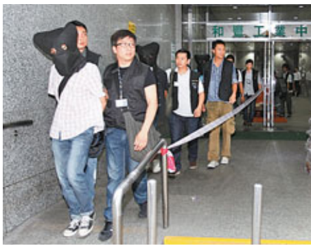
■警方在打磚坪街色情光碟製作中心帶走6名內地男女。

香港文匯報訊(記者 杜法祖) 警方繼續雷厲打擊黑幫收入來源，旺角警區反黑組人員昨分別在葵涌和九龍灣，搗破2個色情光碟生產和包裝工場，當場拘捕6名男女。行動中有疑人一度企圖爬窗逃走，但終於就擒。