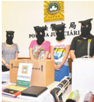
■澳門破層壓集團，拘捕4名男女。

發汪姓女主腦聘用黑工，將另案處理。調查發現，該傳銷集團以推銷具抗癌功效的「神奇果汁」招攬會員，每人入會需購買4,800元貨品作會費。司警稱，每條銷售線最多有8層，若以單線計算，最上層可收取1.4萬元佣金，集團更將會員等資料傳送至香港，逃避警方視線，集團在澳門至少有200名會員，估計犯罪所得數以百萬計。