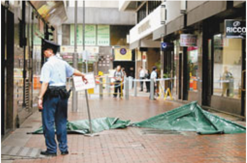
■警員以帳篷將墮樓死亡吊船工人屍體遮蓋。

香港文匯報訊(記者 杜法祖) 尖東帝苑酒店昨晨發生奪命工業意外，一名外判清潔外牆工人，在酒店16樓頂樓外牆落吊船準備開工時，吊船突然45度傾側將他拋出直墮橫巷，當場頭爆肢折身亡，警員到場調查時發覺死者的安全帶仍留在天台，懷疑他事發時沒有扣上安全帶，現場消息稱吊船的鋼纜亦無折斷，勞工處及機電署正調查吊船突然傾側及肇事原因。